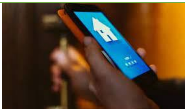
Smartapp – slimme warmtemeter