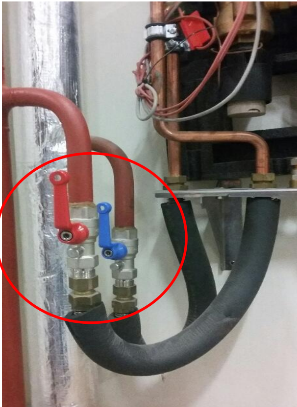
Hoogbouw, afsluiter (parallel) = OPEN