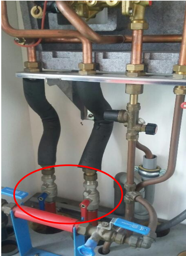
Laagbouw, afsluiter (parallel) = OPEN