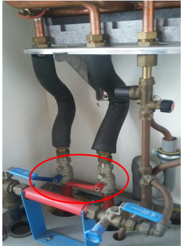
Laagbouw, afsluiter (haaks) = DICHT