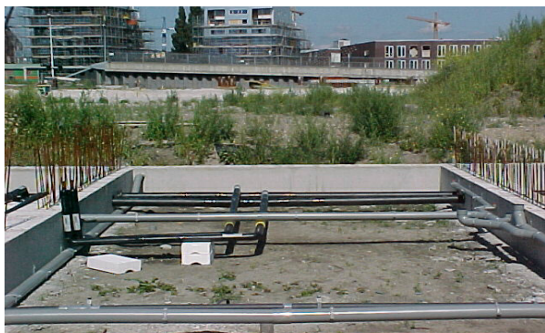
sv-leidingen (zwart) in kruipruimte

Over het algemeen komen die ondergrondse leidingen in de kruipruimte van een (hoek)woning/bedrijfspand uit de grond. Deze leidingen vertakken zich tot kleinere leidingen in de kruipruimte van de woning(en). Het water in die sv-leidingen behoudt de hoge temperatuur.