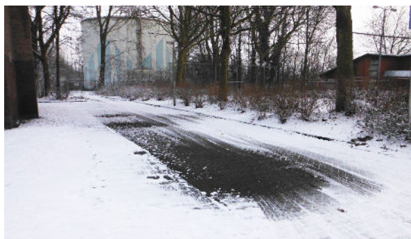
Op deze plek is er mogelijk een lekkage van de stadsverwarming

Wij stellen uw medewerking op prijs, voor zowel uw als onze veiligheid. Een veilige omgeving behouden, doen we samen.